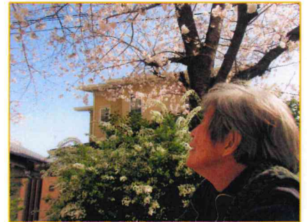
「春の温かさを感じて・・・。」