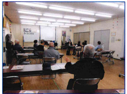
【講話を真剣に聴かれる参加者の皆さん】