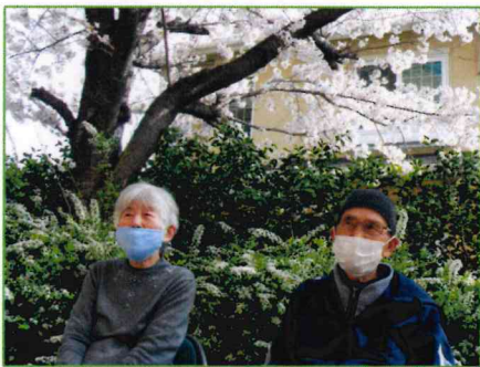
【やっぱり桜はいいね♪】