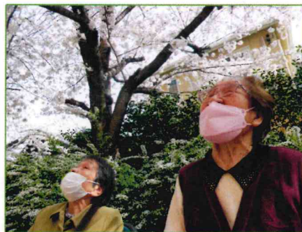
【満開の桜の下は最高やね】