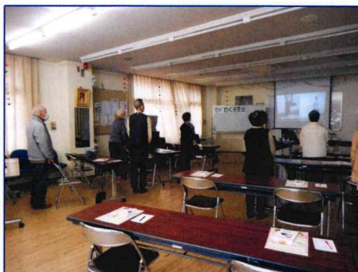
【いつも会場は和やかな雰囲気です】