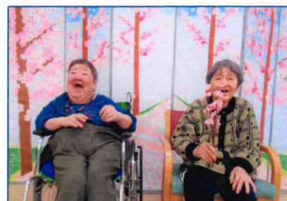
【私達は花より団子やで(笑)】

やわらかな春風が頬に感じられる季節によろしくなりました。特養では、4月3日にお花見行事を行いました。新型コロナウイルスの感染予防対応としてまだ外出を控えざるを得ない状況であるため、施設内にて職員が貼り絵で制作した大きな桜並木が描かれた屏風を背景にして写真撮影を行いました。職員が制作した桜並木の屏風が目の前に広がると「うわ～、綺麗やね～」と拍手と歓声があがりました。皆さんと一緒にお花見に出かけた気分でも、とても笑顔が印象的な撮影会となりました。