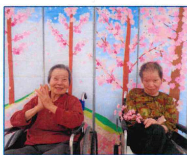
【歌でも歌いましょか♪】