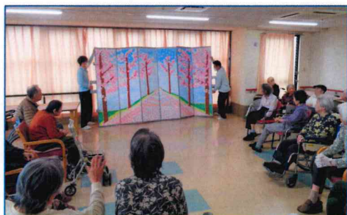
【屏風を開くと歓声が上がりました】