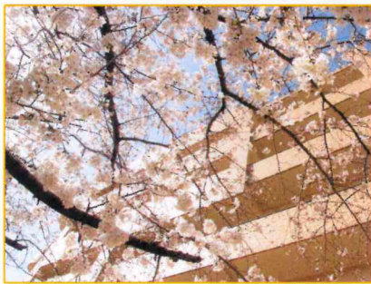
「今年も満開の桜が咲きました！」

当日はお一方ずつ散歩も兼ねて、たちばなの里本館横にある公園の桜見物に向かいました。頭上に広がる満開の桜に、「綺麗なー」と桜を見上げられる方や自慢のポーズで写真撮影される方など、10分程度ではありましたが、有意義な時間を過ごしていただきました。今年も感染者数が減少傾向であるものの、不要不急の外出の自粛により、思うように外に出られない状況が続いていますが、永楽ではこれからも入居者様に楽しんでいただけるような行事を企画していきたいと思っております。5月は「Afternoon tea」を開催予定です。お楽しみに！！