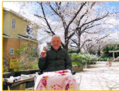
「満開の桜の下ではい！ポーズ♪」