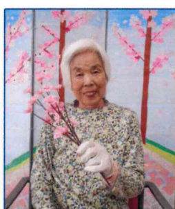
【上品な笑顔が素敵】