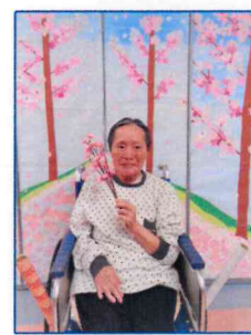
【とても喜んで 頂きました♪】