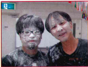
【顔を真っ白にして奮闘しました！】