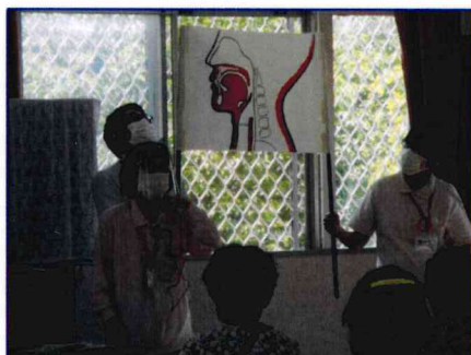
【講話は図の解説もあります】