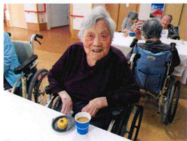
やっぱり和菓子が一番ええな☆