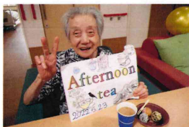
久しぶりのドーナツ！ 美味しい♡