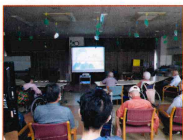
【大きなスクリーンを使用】