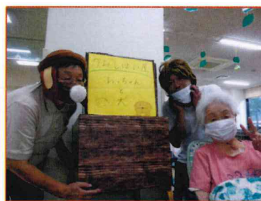
【紙芝居屋のおじさんと犬】