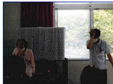
【「嚥下おでこ体操」を実践中】