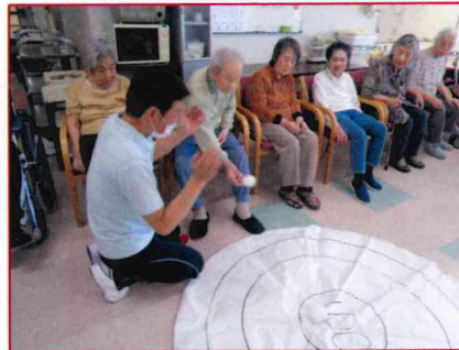
【みんなで応援しました♪】