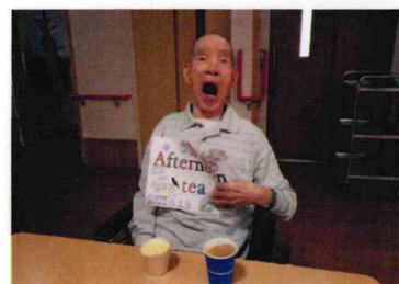
このプリン最高や〜！！

また普段のおやつの時間とは少し違った、ゆったりとした空間の中で職員や他利用者同士で交流ができ、楽しいひと時であったのではないかと思います。