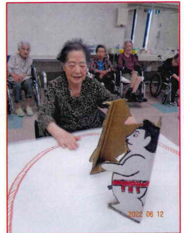
【はっけよ～い、のこった！】