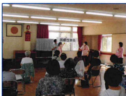
【いつも会場は和やかな雰囲気です】

6月3日(金)に三ノ瀬小地域食事会に参加させて頂きました。はじめに地域包括支援センターについて説明をして、参加者された皆様には地域の身近な相談窓口であることを知って頂きました。講話として誤嚥性肺炎のお話、予防のための体操「嚥下おでこ体操」をお勧めしました。その後はでんでん虫の歌に合わせて指体操を行いました。歌と同時に指を動かすのはなかなか難しいもので、「あれ間違った？」と途中で笑いながら皆さんと一緒に時間を共有しました。