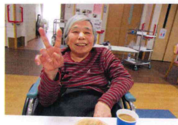
私は洋菓子と和菓子 両方食べたよ♪