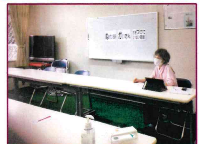
【「づけ」 = かた づ けていない部屋】