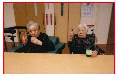
【甘くて美味しいよ！】

永楽では、ユニット行事として料理会を行いました。昼食の時間に餃子、お好み焼き、とん平焼きをお出ししています。「もうお腹満腹やわ」や男性入居者は「ビールが飲みたくなってきたわ」と満足されていました。おやつ時にはメロンクリームソーダも飲まれこちらも好評でした。