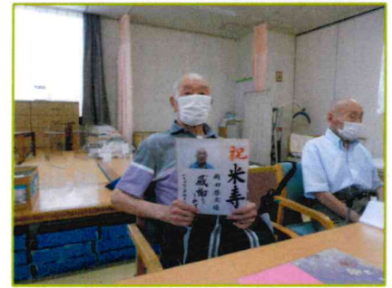
【米寿になりましたよ！】