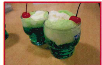
【シュワシュワなメロンクリームソーダ】