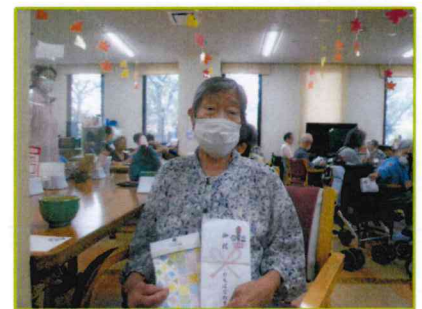
【お元気で長生きして下さいね！】

ご利用者の皆様方には、お茶と一緒に紅白饅頭を召し上がって頂き、粗品をお渡し致しました。皆様に大変お喜び頂け、笑顔がたくさん溢れる敬老会となりました。