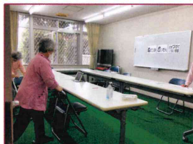
【「か」 = か いだん（階段）】