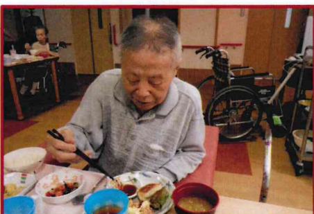
【焼きたてで美味しいわ！】

永楽では、ユニット行事として料理会を行いました。昼食の時間に餃子、お好み焼き、とん平焼きをお出ししています。「もうお腹満腹やわ」や男性入居者は「ビールが飲みたくなってきたわ」と満足されていました。おやつ時にはメロンクリームソーダも飲まれこちらも好評でした。