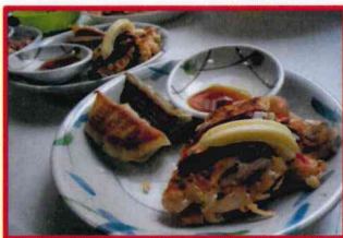
【焼きたての餃子とお好み焼き！】