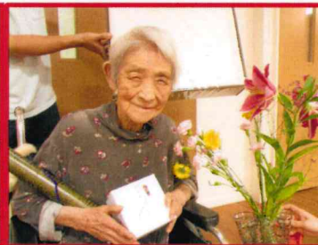
【末永くお元気でいて下さい！】