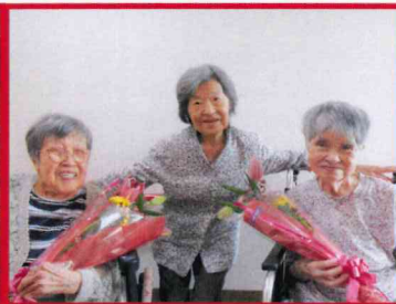
【3人仲良く記念撮影】