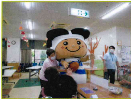
【トライ君登場で〜す】