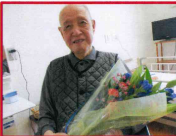
【おめでとうございます！】