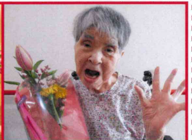
【素敵なお笑顔です！】