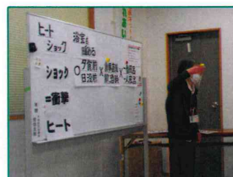
【体調の変化にご注意を!】