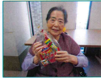
【綺麗に撮影してね】