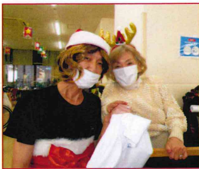
【ちゃんと撮ってね!!】