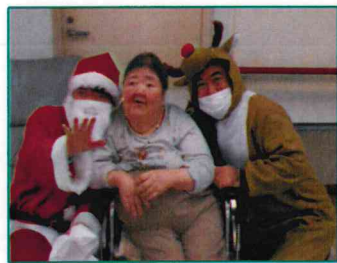
【サンタさんありがとう！】