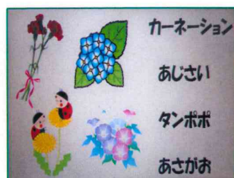
【絵と文字を合せてね!】