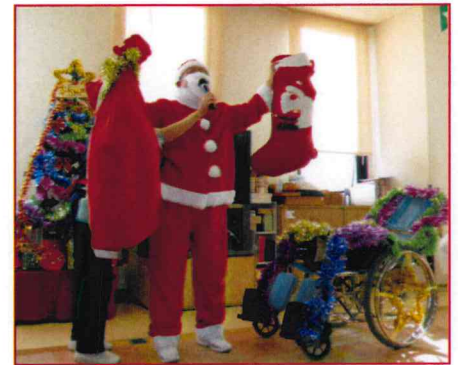
【施設長サンタクロース登場!!】

クリスマス衣装を着用し、職員によるダンスショーを披露しました。とても「楽しくて面白いね」とたくさんの「笑顔」で大盛り上がりでした。恒例のハンドベル演奏では、職員の息もぴったりで、素敵なベルの音色がデイルーム内に響き、たくさんの拍手をもらうことが出来ました。今年、昼食にサンドイッチを召し上がって頂き、デザートにアイスクリームと紅茶を召し上がって頂きました。笑顔が溢れるクリスマスのひとでした。