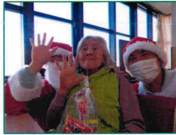
【お菓子もらったよ♪】