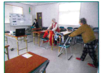
【体操で身体ほっこり♪】