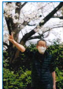
【今が一番見ごろやあ〜】