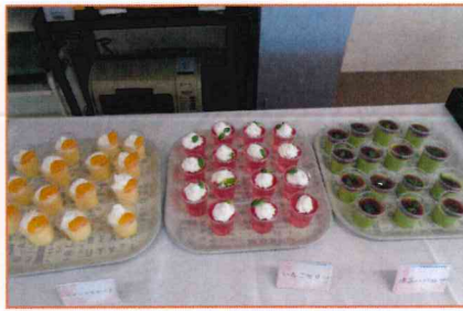
【素敵なスイーツバイキング】