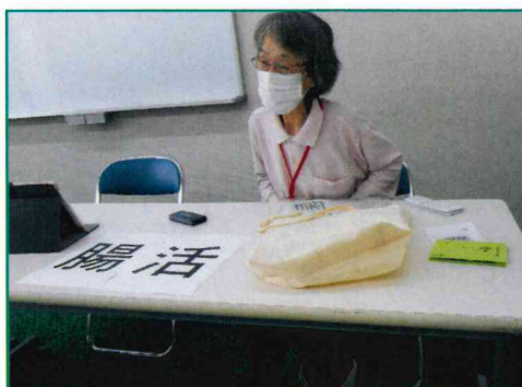
【会場では、いつもこんな感じです】