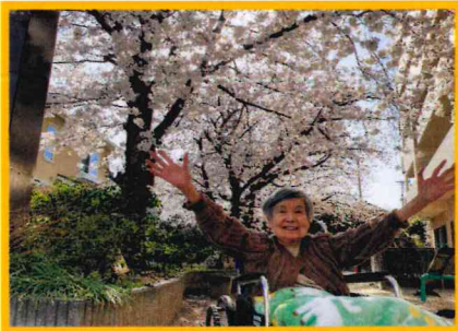
「桜も笑顔も満開ですね！」

例年より少し早い開花で初日より桜はほぼ満開に近い状態で花見日和が続き、皆様久しぶりの外出を楽しまれました。たちばなの里横の公園に少人数にて散歩がてら職員と入居者が談笑しつつ向かいまいりました。公園が見えてくると「わぁ桜見えてきたよ、満開やね」と言われていました。公園に着くと桜を見られ「ほんとに綺麗やね、桜を見ると春が来たねって思うね♪」と職員や利用者様同士で談笑し、お花見を楽しまれました。おやつに和三盆と緑茶を召し上がっていただき「ちょっと寒かったから熱いお茶が美味しい」や和三盆も「綺麗やから食べるのが惜しいけど、甘くてお茶と合って美味しいわ～♪」と好評でした。