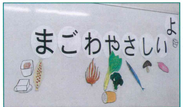
【腸活ってなあ〜に?の説明です】