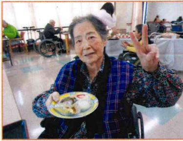
【こんなにたくさんあったよ〜】