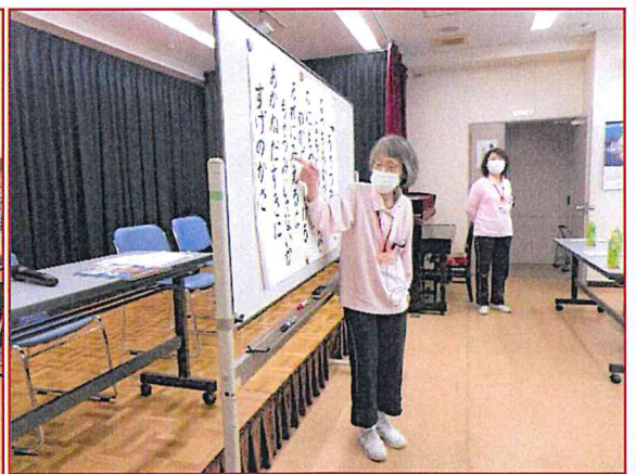
【職員による説明です。】