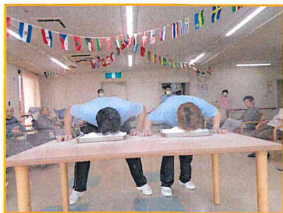
【職員もアメ探して奮闘!!】