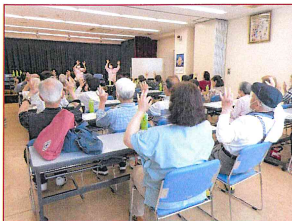
【皆様体操を頑張っておられます。】

令和5年6月4日（日）荒川公民館でのお楽しみ会に参加してきました。まず地域包括支援センターの役割と健康寿命のお話、その後は足腰の衰え予防の体操や脳の活性化のための音読や、座ってできる指体操、手話体操をしました。「東大阪市は健康寿命が短い」という驚きと、指体操では「あれ?間違っ」と笑いが起きていました。地域の皆さんに楽しいひと時を過ごしていただくことができました。