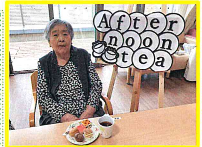
『美味しそうなケーキ♪』