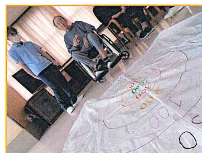
【よく狙って下さいね♪】