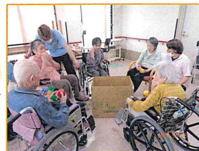
【皆様、準備は万端です!】