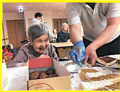
『どれにしようかな？♪』