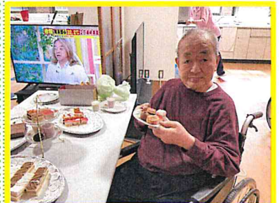
『選んだケーキとパシャリ!』