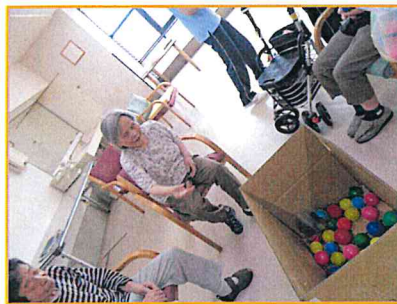
【こんなにたくさん入りました!】