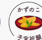
かずのこ 子宝祈願