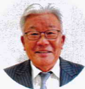
社会福祉法人 光風会 法人本部長