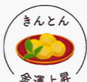
きんもん 金運上昇