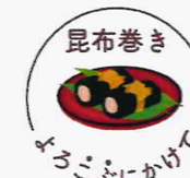
昆布巻き よろこぶにかけて