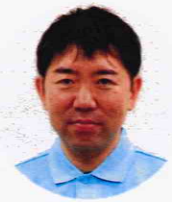
特別養護老人ホーム たちばなの里 別館永楽 施設長

新年明けましておめでとうございます。本年も何卒よろしくお願い申し上げます。 昨年は新型コロナウイルス感染症の位置付けが5月8日より5類感染症になったことに伴い、10月1日から法人全体で「面会・外出・外食自由」などのコロナ以前の施設本来の姿まで大きく緩和いたしました。依然として高齢者施設の大多数では、コロナ禍同様の対応を実施されているので、この決断には賛否分かれるところですが、私たちは「入居者様とご家族様とのかけがえない時間を大切にしてもらいたい」という思いを最優先することにいたしました。コロナとは、これからもうまく付き合っていかなければなりません、この緩和によって入居者様やご家族様をはじめ、地域の皆様の笑顔に直接ふれることができたことが何よりもうれしい出来事でした。今年も私たちは日々挑戦し、皆様に「たちばなの里でよかった」と感じて頂ける施設となるよう、一つひとつ形をしながら前進してまいります。 今後とも何卒ご理解・ご協力の程よろしくお願いいたします。