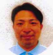
特別養護老人ホーム たちばなの里 施設長

謹んで新春をお祝い申し上げます。昨年は格別なご高配を賜り厚く御礼申し上げます。 昨年は新型コロナウイルスが5類感染症となり、ようやく社会も動き出しました。 社会福祉法人 光風会は、これまでのコロナ禍によって地域の皆様やご家族の皆様と遠くなってしまった「距離」を全力で埋めるべく、これまでにない新たな活動も含めて大きく動き出しました。 面会方法をコロナ以前の状態まで緩和したことを契機として、地域のイベントへ参加させて頂くなど、地域の皆様と共に活動をさせて頂く機会を得ることで、コロナ以前よりも広くつながりができたことを大変ありがたく、喜んでおります。これからも皆様からのお声を丁寧に紡ぎ、地域に根差した法人であるために尽力してまいります。 本年も変わらぬ愛顧のほど心よりお願い申し上げます。