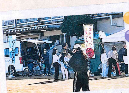
大人気のストラックアウト

11/16(日)に布施小学校で開催された『太平寺校区ふれあい広場』に参加させて頂きました。たちばなの里の出し物は“ストラックアウト”。皆さん奮って参加され景品をゲット♪なんと9枚全部を抜くMR.パーフェクト賞も出て、大盛り上がりでした!!また“福祉車両体験”では、車椅子に乗ったまま昇降機が上がると「おお～、デイサービスに行く人をよく見るけど、こんな感じなのね」と感想を頂きました。福祉を身近に感じていただける体験をこれからも続けていきたいと思えます!!