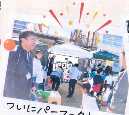
ついにパーフェクトが!!